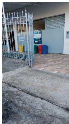
Área externa coberta com toldos, rampa para acessibilidade