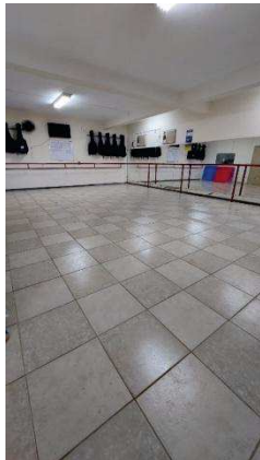
sala para balé/dança e outras atividades socioculturais

Funcionamos em um espaço físico com área externa coberta com toldos, rampa para acessibilidade, mesa e banco de pedra ardósia onde são servidos os lanches; área interna com recepção, banheiros, almoxarifado e duas salas, sendo uma com área ampliada, com espelhos e barras para oficinas de balé/dança e outras atividades socioculturais; uma sala onde funciona o escritório para atividades administrativas, localizado na Rua Pegasus, nº 37. Possuímos, ainda um galpão na Rua Pegasus, nº25 com duas salas que são utilizadas para almoxarifado e uma área de aproximadamente de 200 metros quadrados, com acessibilidade, que são utilizadas para as oficinas de esportes entre outras e, também, para as atividades festivas da Casa do Saber (Festa da Família, junina, etc.).