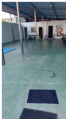
Galpão com área de aproximadamente de 200 m 2 com acessibilidade para pessoas com mobilidade reduzida